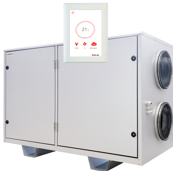
Photo de principe: VR 480 est fourni avec des sorties rectangulaires